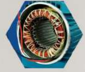
มอเตอร์ ขดลวดทองแดงแท้