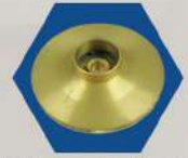
ใบพัดทองเหลืองแท้